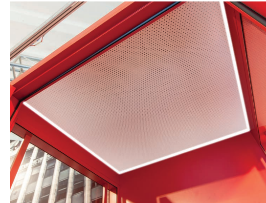
LED-Beleuchtung, die umlaufend auf drei Seiten in der Deckenplatte integriert ist.

Unsere Produkte werden ständig weiterentwickelt und unsere technischen Datenblätter regelmäßig auf unserer Website aktualisiert. Besuchen Sie uns dazu auf www.clestra.com .